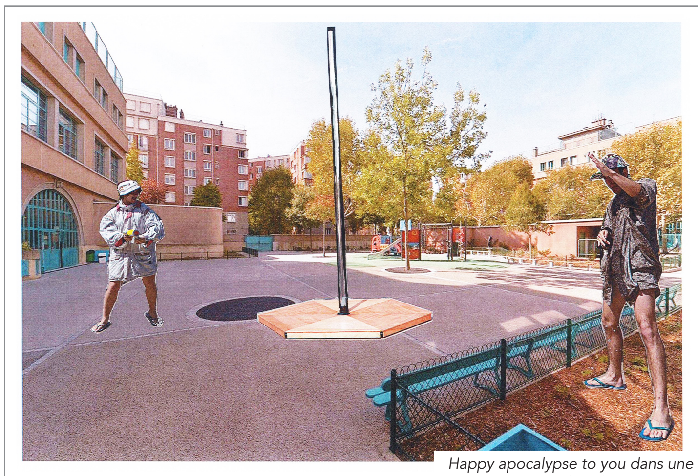
Happy apocalypse to you dans une cour d'école

Mais aussi, grâce à l'adaptabilité et à la légèreté technique du spectacle, il peut jouer dans des espaces en intérieur comme dans une salle polyvalente, un gymnase, un chapiteau etc. pour aller à la rencontre de tous les publics.