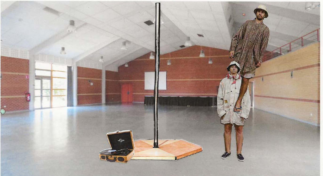
Happy apocalypse to you dans une salle polyvalente

Tous les collages sont réalisés à la main par une enfant sérieuse.