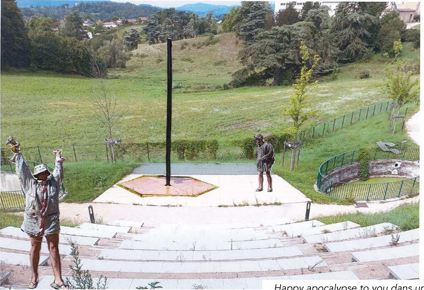
Happy apocalypse to you dans un théâtre de verdure