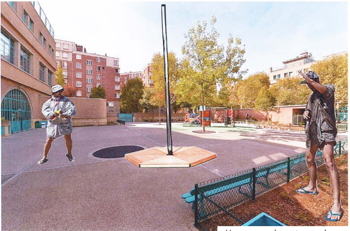
Happy apocalypse to you dans une cour d'école

Mais aussi, grâce à l'adaptabilité et à la légèreté technique du spectacle, il peut jouer dans des espaces en intérieur comme dans une salle polyvalente, un gymnase, un chapiteau etc. pour aller à la rencontre de tous les publics.