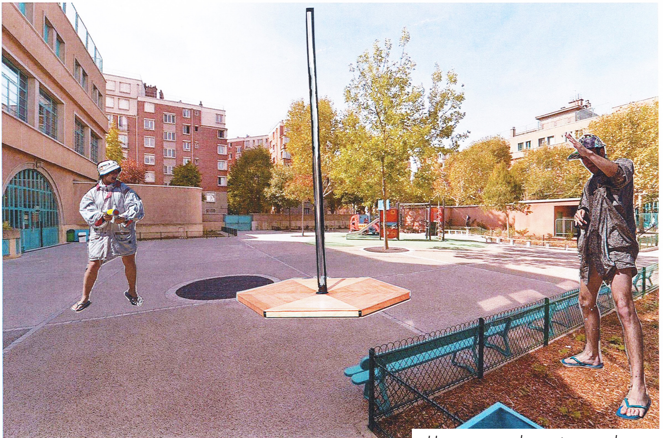
Happy apocalypse to you dans une cour d'école

Mais aussi, grâce à l'adaptabilité et à la légèreté technique du spectacle, il peut jouer dans des espaces en intérieur comme dans une salle polyvalente, un gymnase, un chapiteau etc. pour aller à la rencontre de tous les publics.